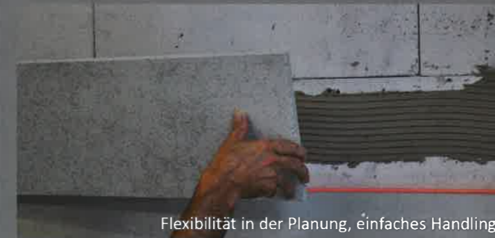
Flexibilität in der Planung, einfaches Handling